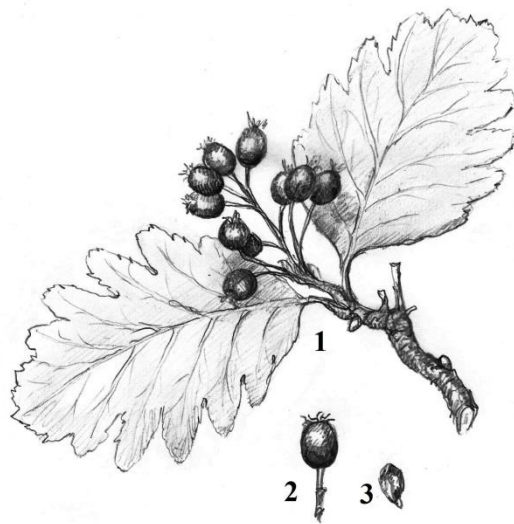
Sorbus caucasica Zinserl. 1 - плодущая ветвь; 2 - плод; 3 - семя