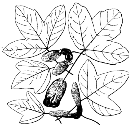
A. ibericum Веіб.

1. Название таксона: Acer laetum С. А. Мей. – Клен светлый