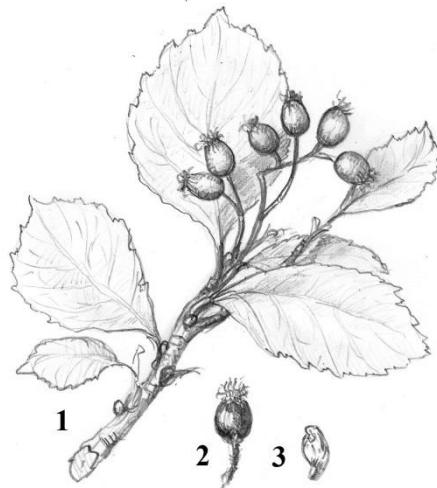
Sorbus kusnetzovii Zinserl.