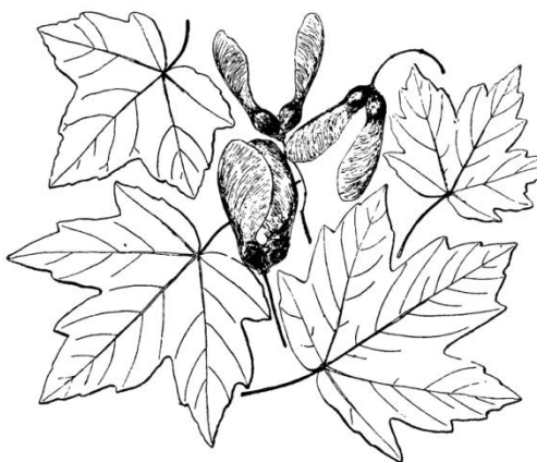
Acer hyrcanicum Fisch. & C. A. Mey.

3. Местонахождение изученной популяции: в верхней части северо-восточного склона Нарат-Тюбинского хребта вблизи г. Махачкала. Координаты: СШ – 42°55'40" ВД – 47°23'22". Высота над уровнем моря – 650 м.